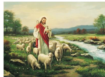
Bygone I have found, My sheep which was lost